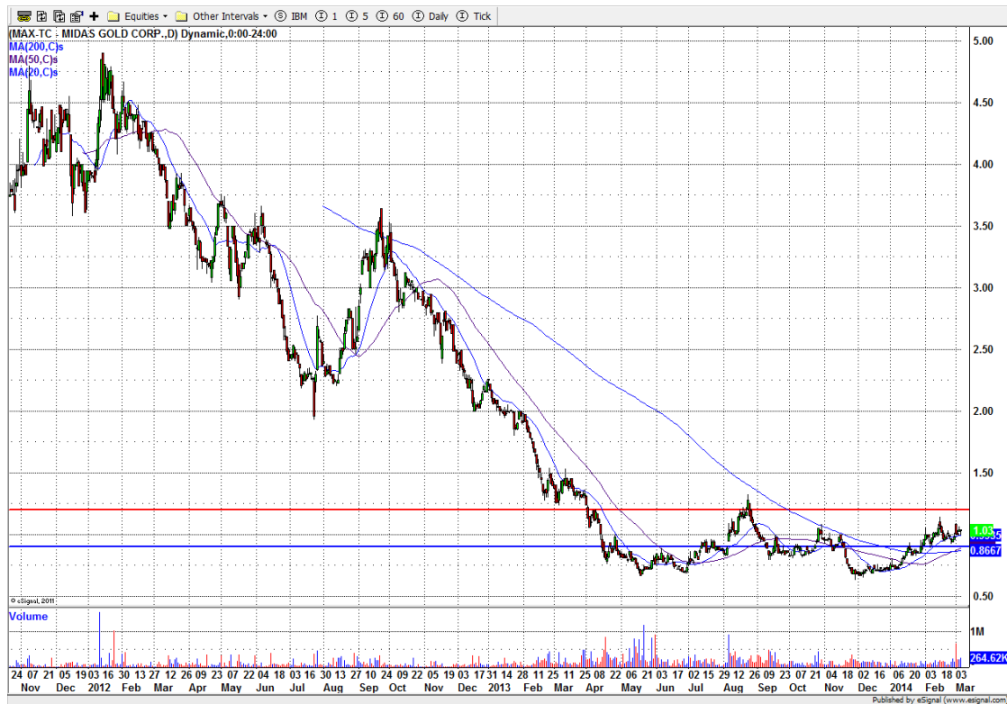
Grafiek Midas Gold. Plaatsingskoers in blauw en uitoefenprijs warrants in rood.

Financieringen als Rubicon en Midas Gold passen in de strategie van PPM. We verwachten de komende maanden meer deals te doen en het geld dat uit eerdere deals vrij komt te herinvesteren. Zo bouwen we een warrant portefeuille op, die bij verder herstellende koersen voor aanvullend opwaarts potentieel zorgt.